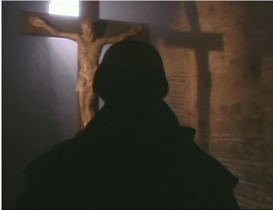
Reformation, Kirchengeschichte ab 14 Jahren